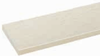
สีรองพื้น