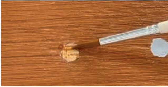
5. ใช้พู่กันจีนปลายแหลมแต้มสีพื้น ทาบริเวณที่ปิว 1 รอบ บดปล่อยให้แห้งประมาณ 30 นาที