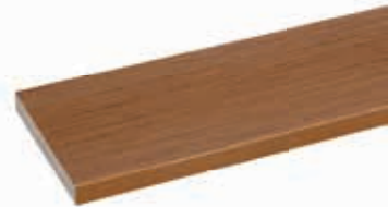
สีเอเชนนิก