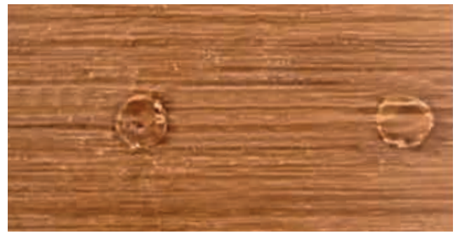
8. หากมีสีที่ทาเลอะในบริเวณที่ไม่ต้องการ ใช้ผ้าแห้ง หรือฟองน้ำชุบน้ำหมาดๆ เช็ดออกทันที