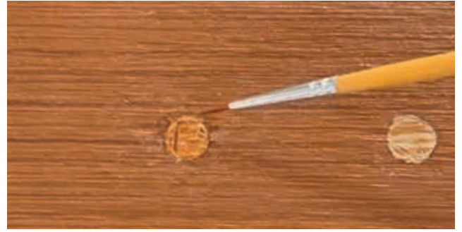
6. ใช้พู่กันจีนปลายแหลมแต้มรอบที่ 2 โดยใช้สีทาบบางๆ อีก 1-2 รอบ หรือจนกว่าสีจะลายกลมกลืนกันตามต้องการ