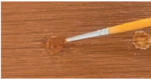
7. แด้มสีรอบที่ 3 โดยเน้นที่การตกแต่งลวดลายเส้น